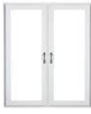
Porte-terrasse avec meneau central fixe (possibilité de pentures sur les murs extérieurs ou sur le meneau)