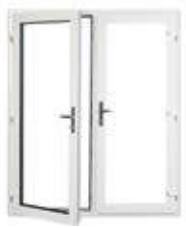
Porte française avec pleine ouverture (pentures sur les côtés et astragale)